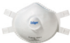
Dräger X-plore 1330 FFP3